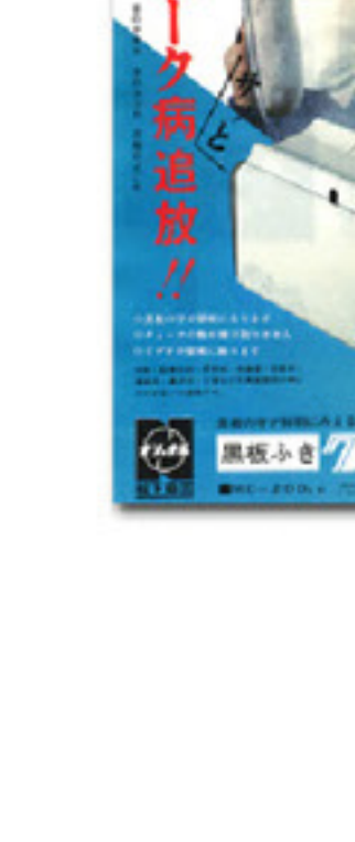
「チェリー」 黒板ふきクリーナー デビュール エニシカ デビュール

そんな、大々な目をした黒板ふき の掃除でしたから、黒板ふきクリ ナーが登場したときには、まさによつ とした騒ぎになりました。 もうパンパと叩かなくてもいい、 粉まみれになる必要もない。2回か 3回すればいいだけで、黒板ふきが きれいになるのが面白くて、みんな が先争って使いたがったものです。 アインというモーター音もいかに も力強く、「きれいになってる」とい う実感がありました。