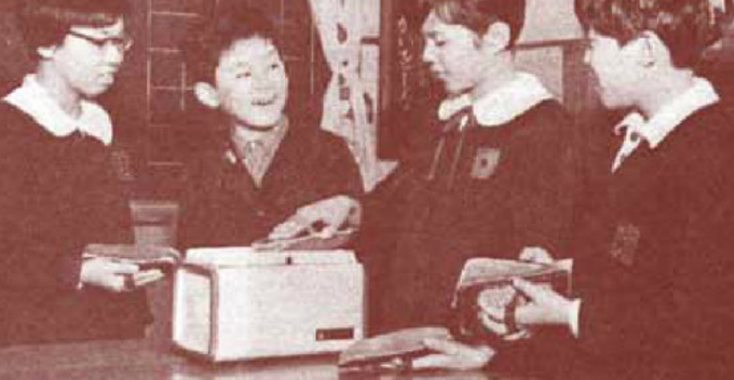
デビュール 黒板ふきクリーナーの まわりにはいつも人だかりが