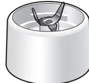
タンブラーコップ台