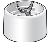
タンブラーコップ台

品番をご確認のうえ、下記フリーダイヤルにご連絡ください 下記ホームページでも受け付けております