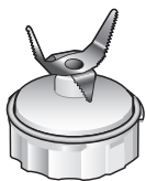
ミキサーカッター