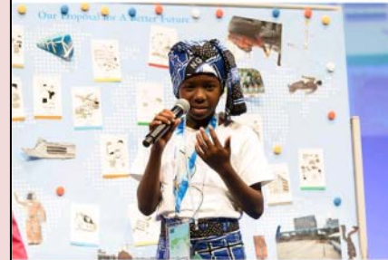
子どもたちはそれぞれの国語次第に声を入れてサミットで「未来社会への提言」を発表

子どもたちの目から見た未来への提言を受け止め、一緒に未来をつつていきたい」とその意義を語る。