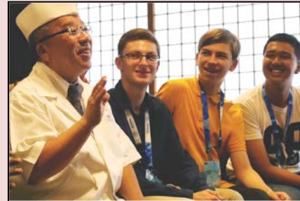
【熱と凍】グループ（タイ・タンザニア・ドイツ）では、脳病、ゴキブリ駆除で日本の「HotBrain」開発し、差別化