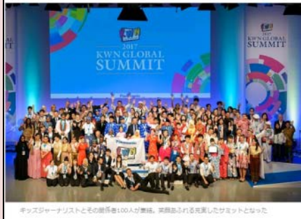
キッズジャーナリストとその関係者100人が集結、笑顔あふれる充実したサミットとなった。

パナソニックがグローバルに展開する映像制作の教育プログラム「KWN」。1989年にアメリカでスタートしたKWNは、次世代の子どもたちの創造性、コミュニケーションスキル、チームワークを養うことを目指し、これまで世界中から18万人以上の子どもたちや先生が参加してきた。