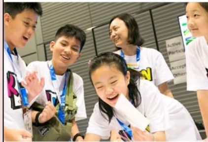
自分の国とはほかの国の違いを知り、理解を深めるきっかけに

8月2日は次世代を担うリーダーとして、「世界がもし100人の村だったら」を題材とし世界の多様性と格差を体感するアクティブ・ラーニング。その後、東京を8テーマに分け子どもたちの視点で取材活動・日本社会体験を行うフィールドワークを開催。8月3日は「未来社会への提言」をテーマに自国や他国の違い、東京取材を踏まえたディスカッションをし、翌8月4日に発表を行った。