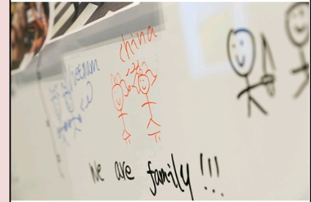
We are family—子どもたちの国語や文化を超えた絆が未来をつくる