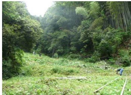
「枚方穂谷」棚田の様子