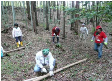
「やしろの森」竹の伐採風景

今後、パナソニックエコリレージャパンとして、これまでの森林・緑地・水辺などでの清掃を中心とした活動から、里山保全・生物多様性保全につながる活動へも領域を拡大し、定期的に地元NPOと連携して活動継続して行きます。(2011年度関西エリアのモデル活動としてスタート)