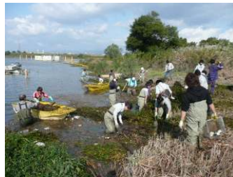
イタセンパラ保全活動