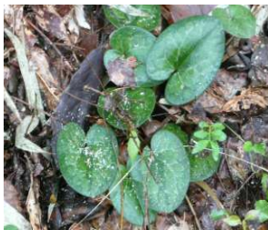
ギフチョウ保全活動

エコリレー活動報告数、グローバル586活動(89031名参加)、国内296活動(39971名参加)、できたこととして、① 里山再生など関西で活動スタート(生物多様性保全活動の推進)、② 九州、四国、神奈川など、地域別のゆるやかな活動推進ネットワークづくり、③ 退職者会との連携などを報告。