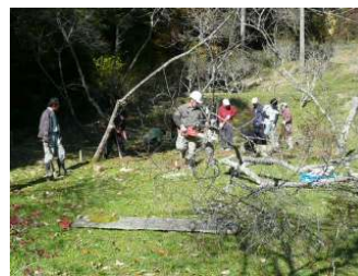
里山保全(再生)活動